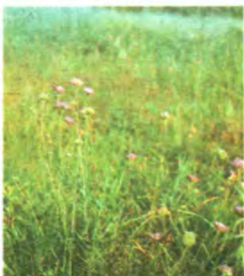
599. Свербіжниця польова.